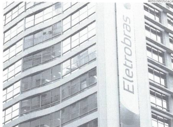
Com aprovação do texto-base, secretário diz que valor de mercado da estatal aumentou em R$ 30 bilhões

De acordo com o secretário, o preço de mercado da Eletrobras aumentou em R$30 bilhões, após a aprovação da medida provisória. Ele completou sua fala ressaltando que a privatização da estatal irá renovar a habilidade de investimento da empresa. "A privatização reorganiza o setor elétrico brasileiro, pois elimina os contratos de cota, beneficiando o MRE (Mercado de Realocação de Energia), direcionando recursos inéditos para a CDE e promove a redução tarifária", finaliza Mac Córd.