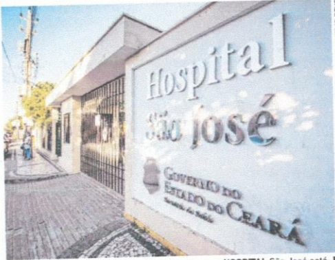
HOSPITAL São José está com a UTI lotada

"Foi um aumento muito específico, que nos deixa muito preocupados", relatou o gestor em vídeo publicado na rede