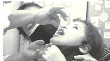
Em Fortaleza, estima-se que 130 mil crianças devam ser vacinadas contra a poliomielite

Meta do Ministério da Saúde para a vacinação é de 95% do público alvo; prazo em Fortaleza foi novamente prorrogado até o dia 31 de outubro