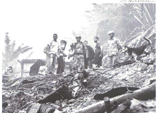
Na semana passada, um deslizamento de terra matou uma mulher e duas crianças em Aratuaba

Dados preliminares da Fundação Cearense de Meteorologia e Recursos Hídricos (Funcemete), referentes aos cerca de 50 dias de queda de chuvas, revelam que o município de Uruburetama, localizada a pouco mais de 30 km de Fortaleza, teve o maior acúmulo de chuvas no período, com um total de 656,7 milímetros. A média histórica do município para o período é de 443,3 milímetros, ou seja, houve um excesso de 48,1%. É importante destacar que, durante o fim de semana de Ferrel, teve o maior acúmulo de chuvas no período, com um total de 656,7 milímetros. A média histórica do município para o período é de 443,3 milímetros, ou seja, houve um excesso de 48,1%. É importante destacar que, durante o fim de semana de Ferrel, teve o maior acúmulo de chuvas no período, com um total de 656,7 milímetros.