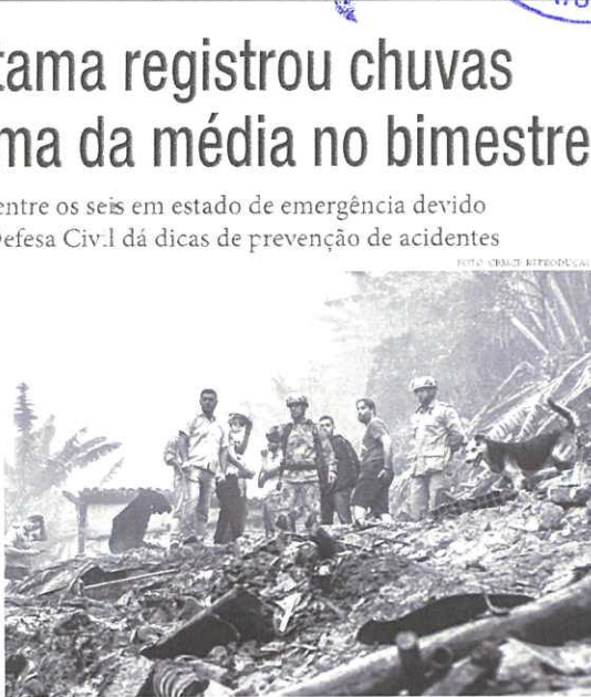
Na semana passada, um deslizamento de terra matou uma mulher e duas crianças em Aratuaba