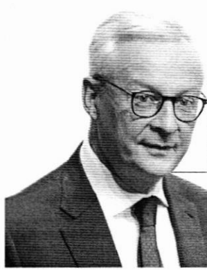
A fala do ministro da Economia ocorre em meio a protestos protagonizados pelos agricultores na França

Le Maire não foi a primeira autoridade do governo francês a falar negativamente sobre o acordo com o Mercosul. Nesta semana, o próprio presidente Emmanuel Macron chegou a pedir pelo fim das negociações, argumentando à Comissão Europeia que seria "impos-