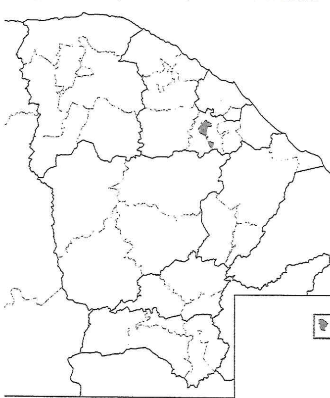
Dados estatísticos do Município de Baturité.