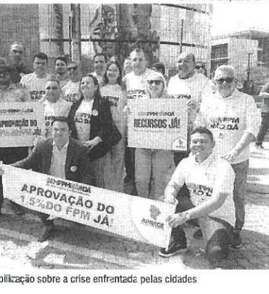
Prefeitos cearenses durante mobilização sobre a crise enfrentada pelas cidades

A entidade que representa os municípios brasileiros demonstrou preocupação e classificou como inconstitucional o projeto de lei, aprovado pelo Senado Federal, sobre a recomposição do Fundo de Participação dos Municípios (FPM), até dezembro deste ano. A proposta buscava reduzir os impactos da crise enfrentada pelas prefeituras, mas os senadores incluíram uma medida que flexibiliza os valores mínimos a serem aplicados pela União na área da saúde, que pode representar até R$ 20 bilhões a menos. Em nota divulgada nessa quinta-feira (5), o presidente da Confederação Nacional de Municípios (CNM), Paulo Ziulkoski, denuncia com perplexidade manobra realizada no Congresso Nacional e diz que "espantoso" a ampla maioria do Congresso Nacional alterou, por meio de um projeto complementar, a Constituição. Alguns senadores chegaram a se manifestar contrários, "inclusive com emenda destinada para supressão na Comissão de Constituição, Justiça e Cidadania, mas esta foi derrubada por 5 votos a 11 em votação nominal. Desrespeitam a Carta Magna e prejudicam o direito mais básico do cidadão, que é o acesso à Saúde, pegando a conta em um projeto legitimo."