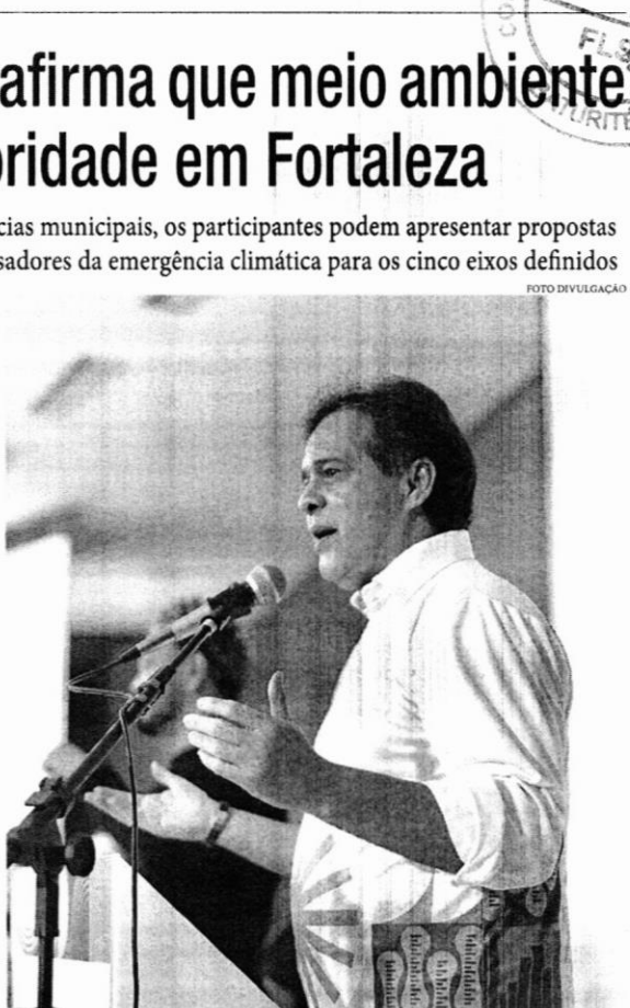
O prefeito Evandro Leitão destacou a limpeza dos recursos hídricos e a reavaliação de processos de exclusão e substituição de áreas verdes da cidade

Prevenção chuvvas. O prefeito Evandro Leitão, acompanhado da vice-prefeita Gabriela Aguiar, de vereadores e de secretários municipais, visitou áreas de risco no Conjunto Tarcato Neves, no bairro Jardim das Oliveiras, e em comunidades do entorno da Lagoa da Sapiranga, na manhã deste sábado (25/1). Durante os percursos, foi verificada a situação de cada local e as medidas necessárias para prevenir e mitigar impactos causados por fortes chuvas.