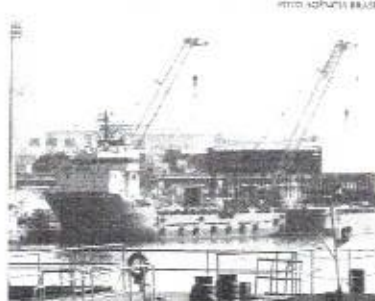
Governo prevê que superávit alcance a quantia de US$105,3 bilhões neste ano. BC projeta US$70 bilhões

das commodities sustentou as exportações. Em julho, o volume de mercadorias embarcadas sofreu retração de 8% no igual período de 2020. Porém, os valores tiveram aumento de em média 43,1% na mesma comparação. O milho, um dos produtos mais exportados, sofreu queda na safra devido às secas e geadas, o que ocasionou a retração de US$223 milhões em julho na comparação com o mesmo mês do ano passado.